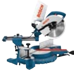
GCM 10 S Professional