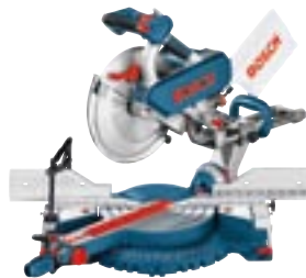
GCM 12 SD Professional